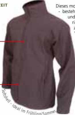
Softshell - ideal im Frühling/Sommer

Dieses modular aufgebaute Bekleidungs-System - bestehend aus 3 eigenständigen Jacken und mindestens 5 verschiedenen Tragevarianten - sorgt dafür, dass man das ganze Jahr über flexibel auf die jeweilige Wettersituation reagieren kann. Obwohl ursprünglich für den Bergsport entwickelt, lässt sich die hoch atmungsaktive Soft-Shell-Jacke dank ihrem hohen Tragekomfort auch ausgezeichnet für den urbanen Lebensstil verwenden. Sie sieht sehr elegant aus und schützt ideal vor Wind und Feuchtigkeit. etc... Bewusst wurde auf die Anbringung des Logos auf der Jacken-Aussenseite verzichtet!