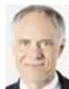
Bundesrat Moritz Leuenberger in seiner erfrischend-humoristischen Rede an der Delegiertenversammlung in Frauenfeld.

«Es lohnt sich immer, der aktuellen Mode Beachtung zu schenken. Trotzdem, ich habe heute keine Burka angezogen.»