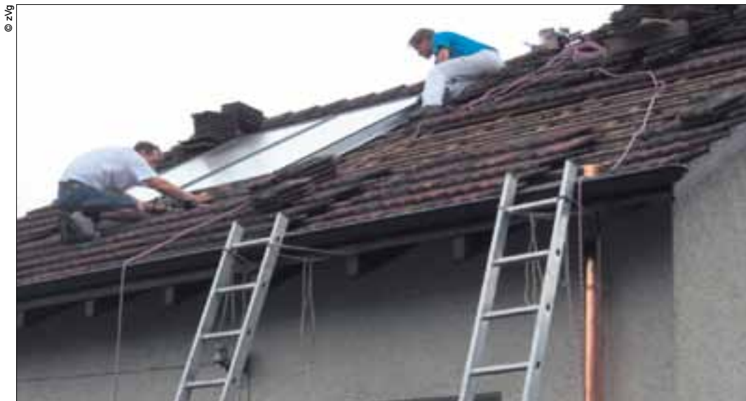
Die Zukunft ist nicht atomar: Auch auf Max Chopards Dach wird ein Solarpanel montiert.