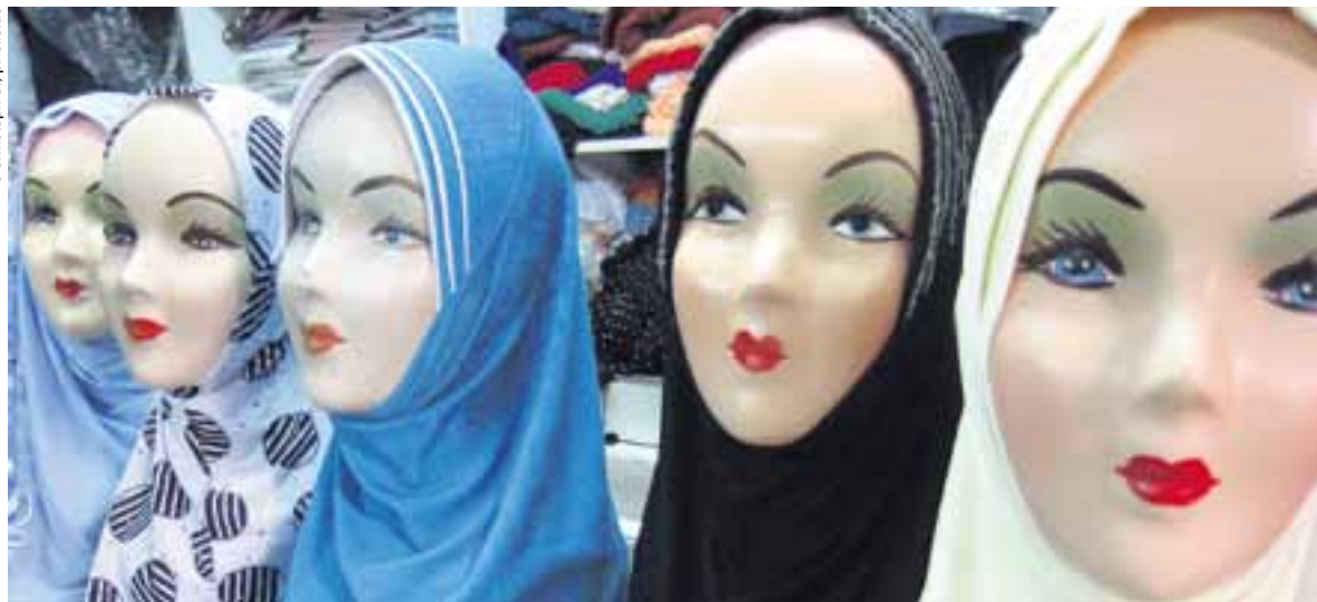
Kopftuch, Tschador, Burka: Islamische Frauenbekleidung sorgt für Diskussionsstoff.